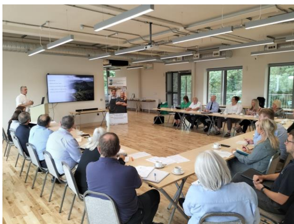
1 - Trafod sgiliau digidol a rhwystrau yn ein Grŵp Clwstwr Busnes Digidol.