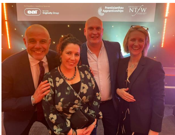
2 - Bu Teresa ac aelodau tîm y Bartneriaeth Sgiliau Rhanbarthol yn cefnogi ac yn mynychu Gwobrau Prentisiaethau Cymru 2024 a drefnwyd gan Ffederasiwn Hyfforddiant Cenedlaethol Cymru, gan ymgysylltu ag amryw siaradwyr. Roedd y gweithdai'n ymdrin â thwf ymhlith busnesau bach a chanolig, a heriau o ran recriwtio a deallusrwydd artifisial.

Ar hyn o bryd, rydym wrthi'n mapio'r ddarpariaeth o ran hyfforddiant ar gyfer y sector Adeiladu ac Ynni yn y rhanbarth a thros y ffin. Yng nghyfarfod diwethaf y clwstwr Adeiladu ac Ynni ym mis Ebrill gwnaethom wahodd NPTC, Coleg Sir Gâr a Choleg Ceredigion i roi cyflwyniadau ynghylch eu darpariaeth ym maes adeiladu. Roedd hwn yn gyfle i fusnesau adrodd yn ôl i'r colegau ynghylch eu gofynion.