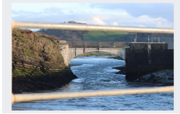
4 - Cymunedau Ceredigion yn cael eu hannog i "fabwysiadu" eu hafonydd lleol- Cyngor Sir Ceredigion